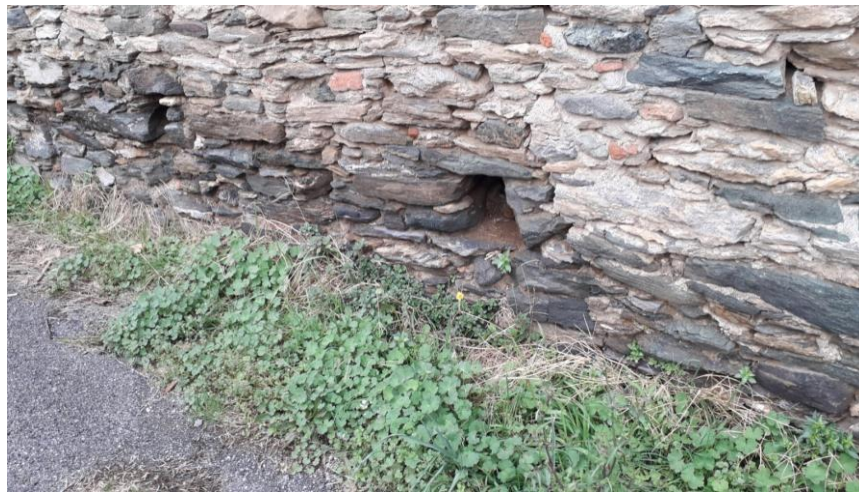
Foto 6 Dettaglio muro da smontare e ricostruire