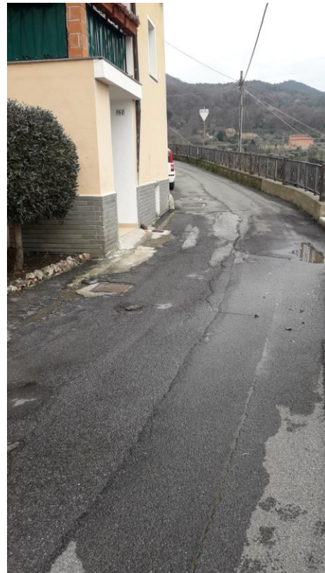
Foto 3-4 Paramento lesionato e dettaglio via alla Fontana