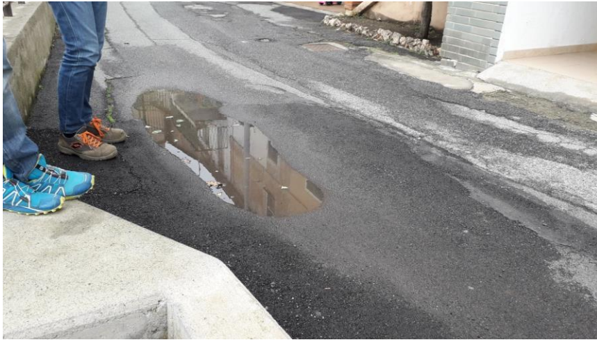
Foto 5 Porzione di via alla Fontana oggetto di intervento